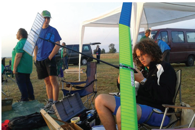
Pred vsakim startom sta potrebna pregled in prilagoditev modela trenutnim letalnim pogojem