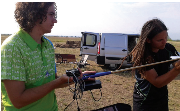
Programiranje elektronskega vezja za krmiljenje modela