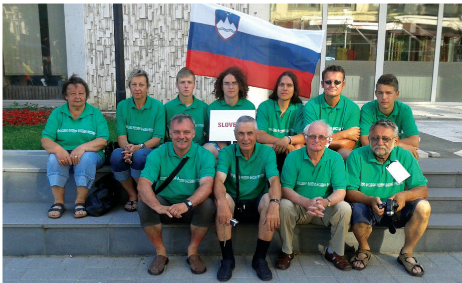
Celotna ekipa Slovenije s pomočniki in spremljevalci

Evropska mladinska prvenstva potekajo vsako drugo leto, letošnjega v organizaciji Bolgarske zveze letalskih modelarjev se je po podatkih organizatorjev udeležilo 80 tekmovalcev iz 16 držav. Teren, na katerem so tekmovali mladi evropski modelarji s prosto letečimi modeli, leži nekoliko višje, na vzpetini z umetnim zadrževalnikom vode, iz katerega so speljani kanali za namakanje polj. Travnati del terena predstavljata dve pristajalno-vzletni stezi vzletišča za letala, ki skrbijo za škropljenja kmetijskih zemljišč v okolici. V obeh smereh je ob stezah približno 0,5 x 2 km travnišča, ki ga obkrožajo polja s pšenico, koruzo in sončnicami. Slovenska ekipa je dni med tekmovanjem za svetovni