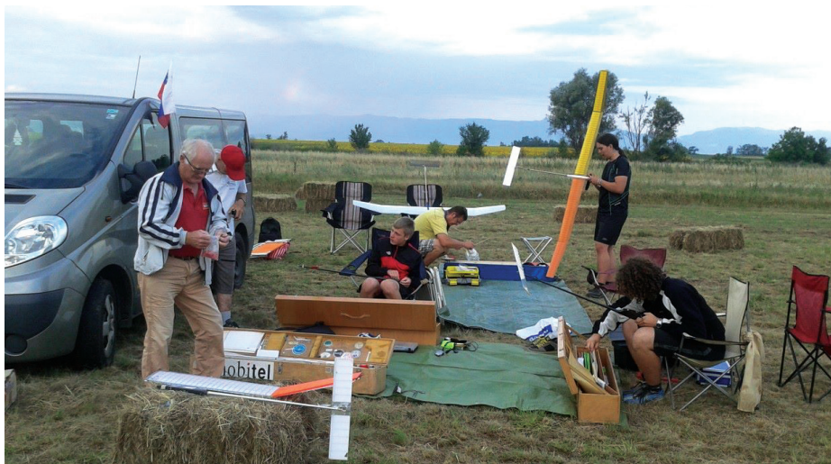
Vsak tekmovalec lahko uporablja največ štiri modele, nekateri so primerni le za določene vremenske razmere.