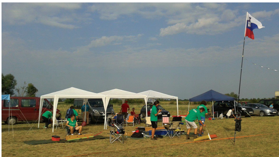
Slovenski kotiček ob tekmovališču