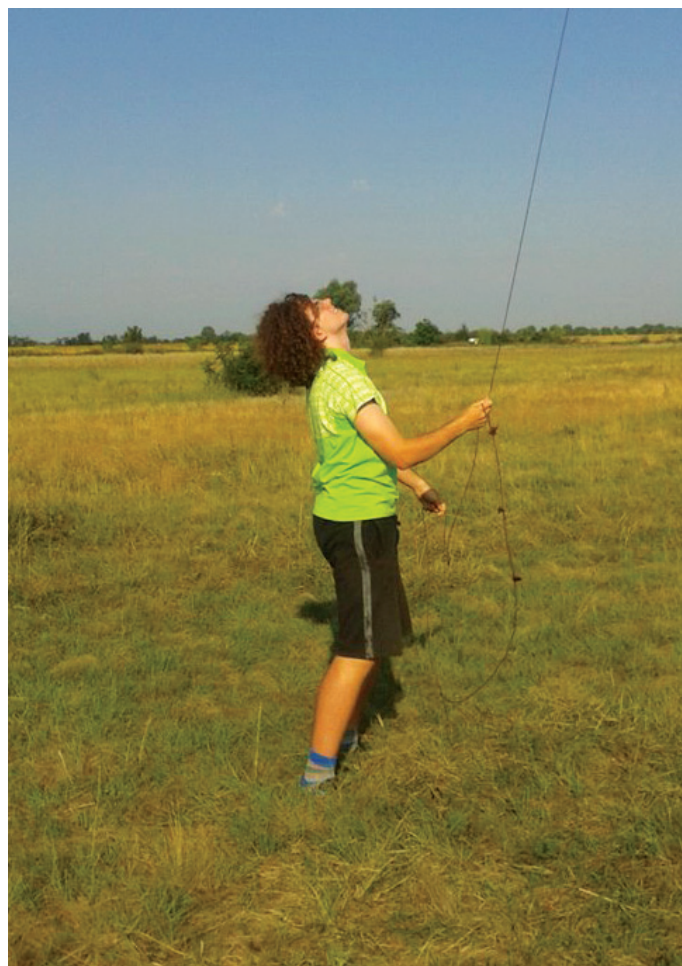
Z modelom na vrvi

pokal in evropskim prvenstvom izkoristila za dodaten trening. Ob tem so fantje spoznavali precej posebne zračne pogoje terena z ozkimi stebri termike.